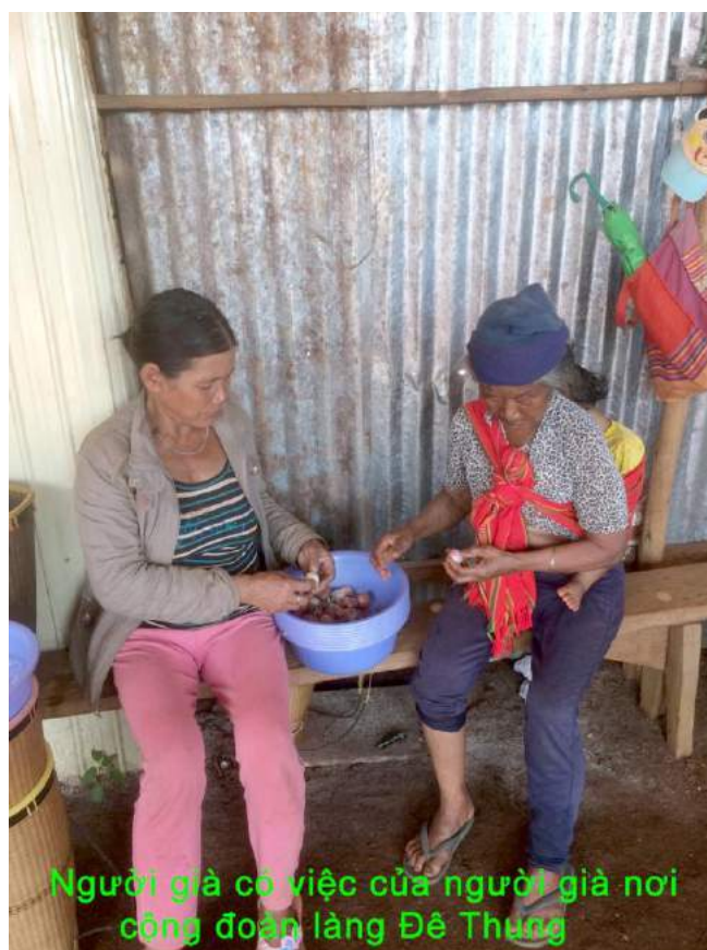
Người già có việc của người già nơi cộng đoàn làng Đê Thung

- Trăm nghe không bằng mắt thấy, con mời đoàn theo con đến các làng, để có dịp cảm nhận đời sống thường nhật của những người Công giáo sắc tộc nơi vùng núi cao này.