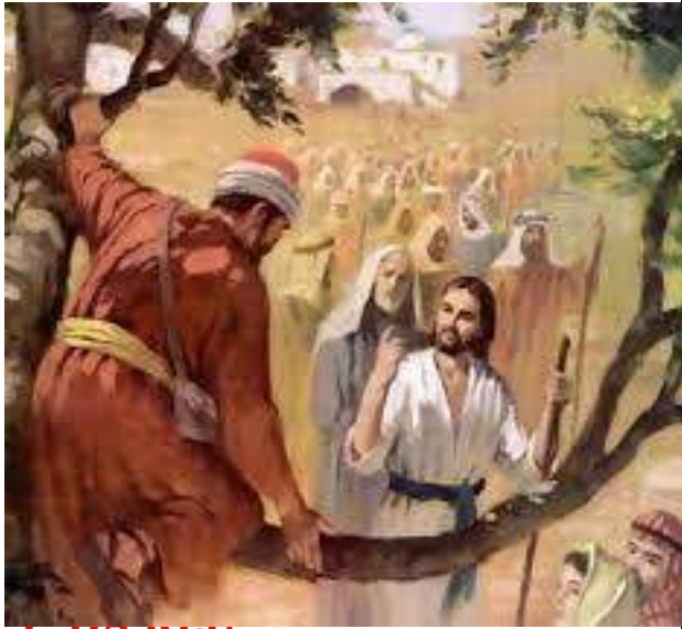
1. DA KÊU